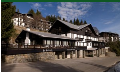
LOCANDA BOCCHETTO SESSERA

POSSIBILITA' DI PERNOTTAMENTO E PENSIONE PRESSO: ALBERGO BUCANEVE